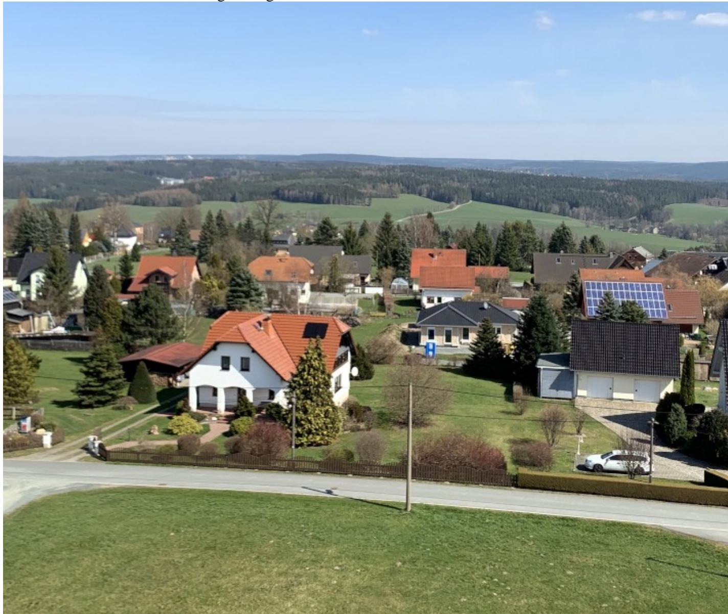
Wohnsiedlung am Turm

Ausblick in alle Himmelsrichtungen möglich