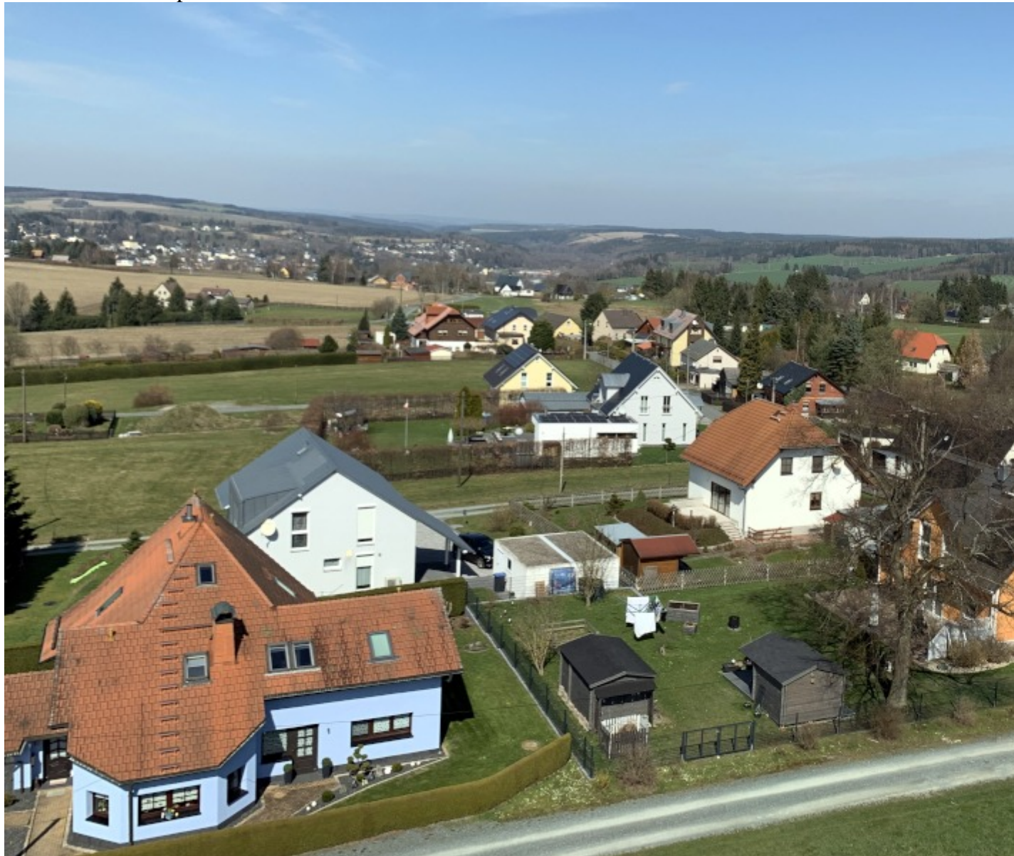
Aussicht über die Siedlung in die Ferne