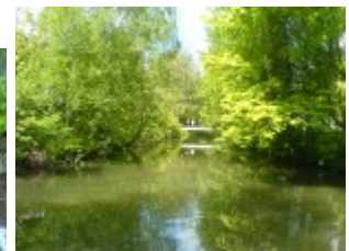
Romantisch sind die Bäume über das Wasser gewachsen