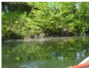
Ruder ins Wasser

Passend zum Bootsverleih gibt es auf der Insel einen überdachten Freiluft-Imbiß . Ebenfalls auf der Insel ist das Museum "Göltzsch" .