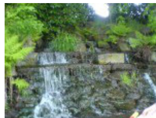
Zufluss in den Graben