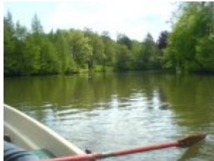
Blick nach vorne auf dem großen Wassergraben