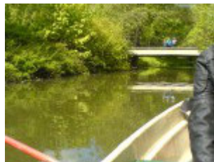
Auf dem Weg zur Brücke