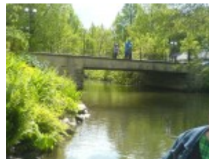
Durch die Brücke durch gerudert