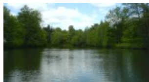
Herrlich ist es auf dem Wasser