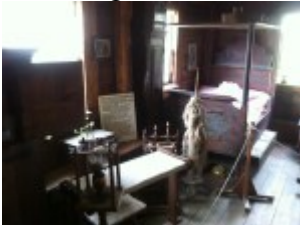
Arbeitsplatz und Schlafräum