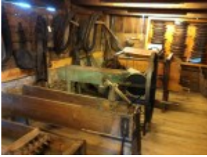
Arbeitsgeräte der Bauern