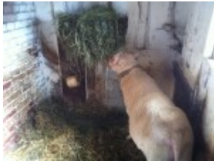
Stall im Bauernhaus