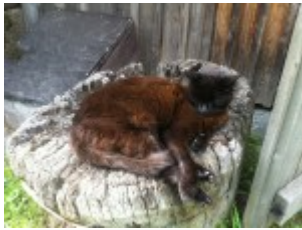
Katze sonnt sich