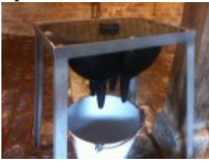
Probiergerät zum Selber-Melken