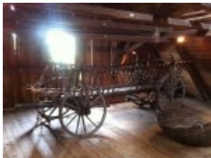
Stroh- und Heuwagen