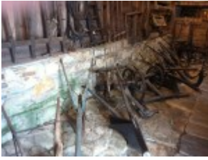
Arbeitsmaschinen für Pferde auf dem Feld