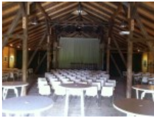
Veranstaltungsraum in der Kulturtenne