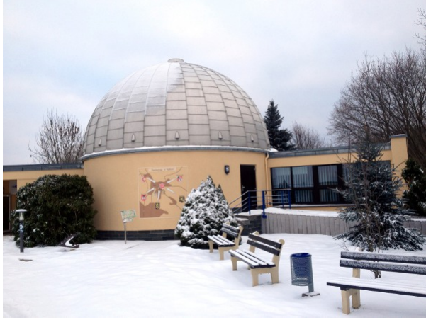
In dieser Kuppel befindet sich das Planetarium

Ein Planetarium ist eine bezaubernde technologische Erfindung! Man muss es einfach mal gesehen haben.