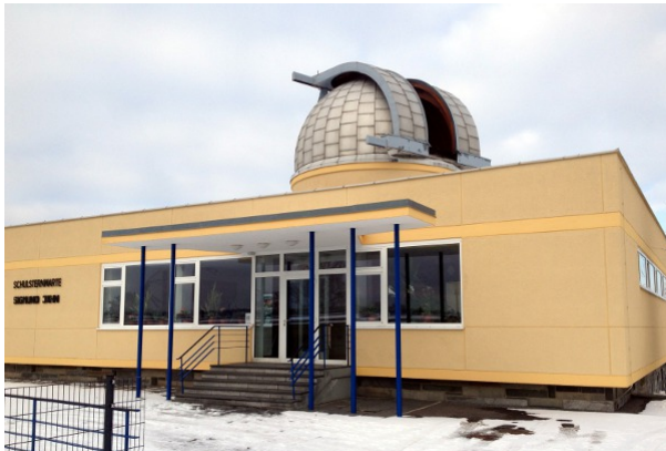
Sternwarte mit geöffneter Kuppel. Das Fernrohr befindet sich in der Kuppel.

Bei schönem Wetter kann man sich den ganzen Spaß am echten