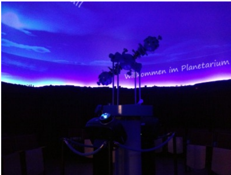
Projektoren in der Kuppel