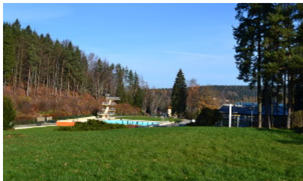
Bad mit 10m-Sprungturm und Liegewiese