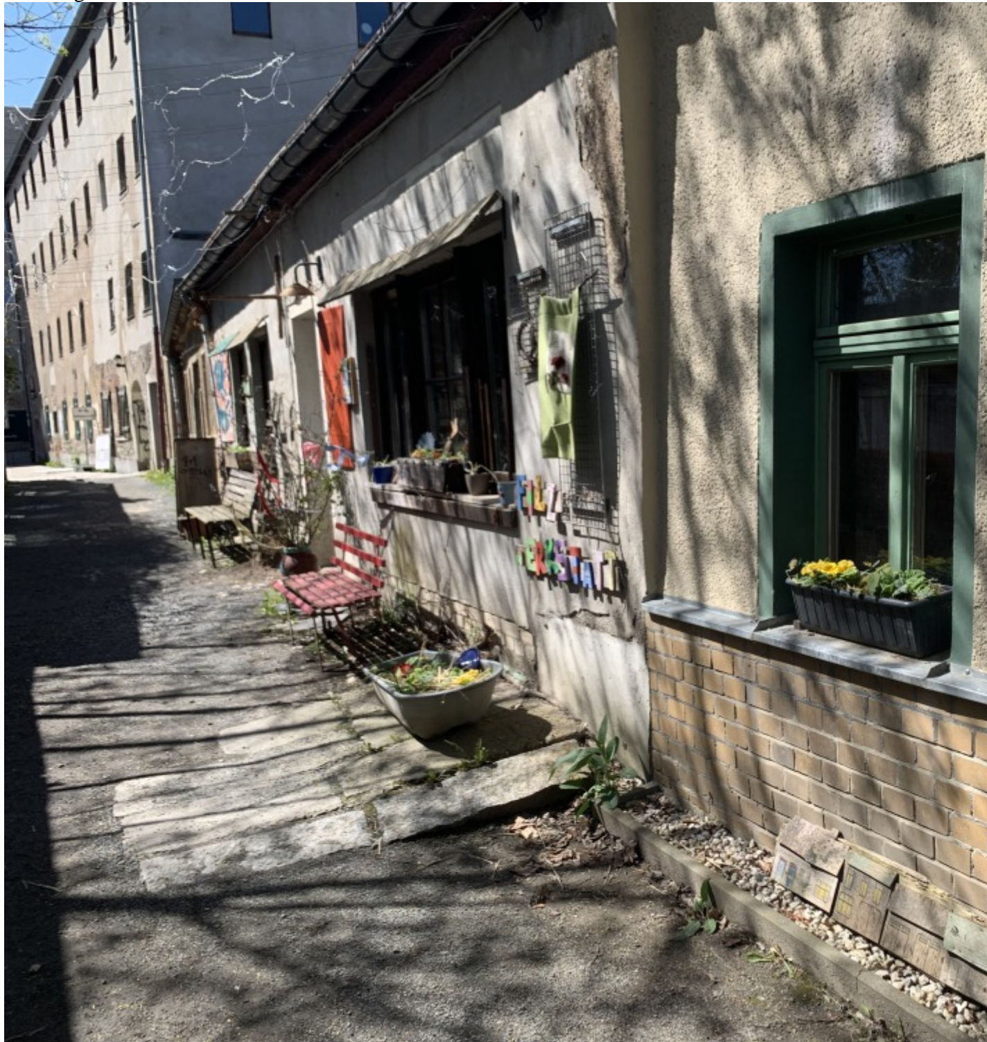
Bunte Fenster, hinter denen sich die Werkstätten befinden