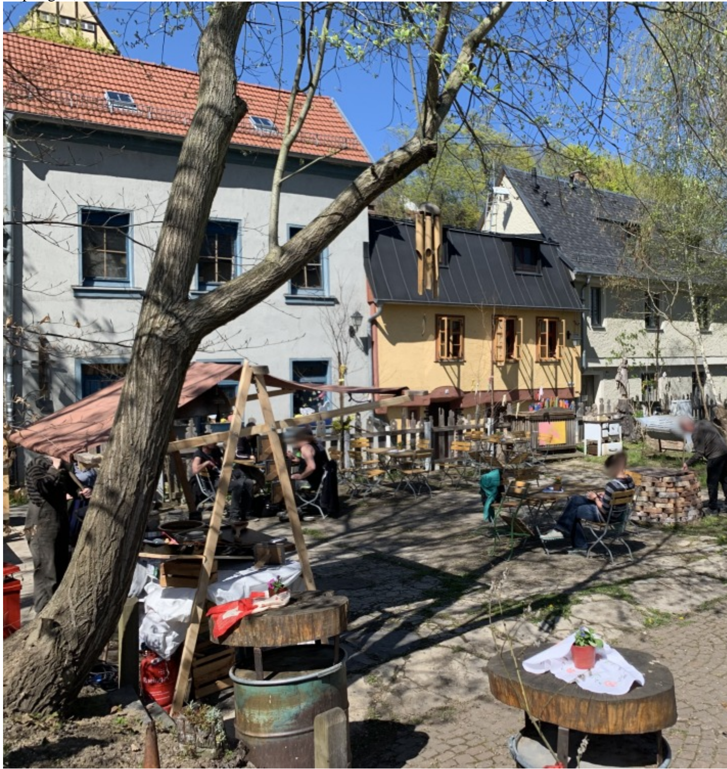
Veranstaltung im Hinterhof mit Verkauf und Bastelmöglichkeiten

Gepflegter, aber dennoch natürlicher Garten im Hinterhof, bei dem die Zeit stehen geblieben ist.